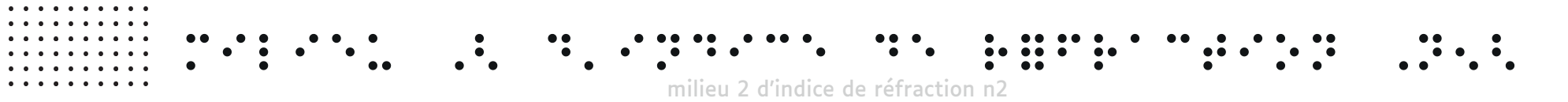
milieu 2 d'indice de réfraction n_2